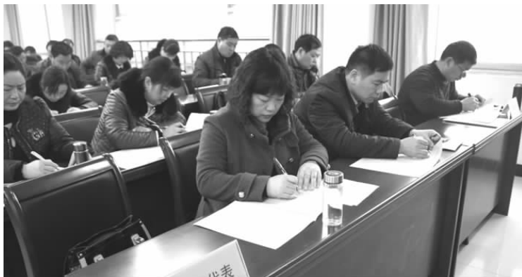
日前，安宜镇召开基层站所“点点评”和村居“述询评”工作会议，邀请了部分县人大代表、政协委员代表、企业工商户代表等。会上，围绕履职情况、完成目标、提升效能、廉洁自律等方面，镇财政所、水务站、农经中心、农技中心、劳动所5家单位负责人，进行了现场述职，其他单位采取书面述职的形式，接受监督和评判。

为坚决把中央八项规定精神落到实处，开发区国土所采取措施、落实责任，一是领导率先垂范，以上率下，认真履行“一岗双责”。二是向上级机关明查暗访中“踩红线”、“闯雷区”的行为发现一起查处一起，坚决防止选择性执纪、初犯不查、小错不纠等问题。三是在服务过程中有违纪、不作为或乱作为的人和事要敢于问责、敢于执纪。四是以履职尽责、正风肃纪的实际行动，确保廉洁过节，维护好国土部门的良好形象。(时杰)