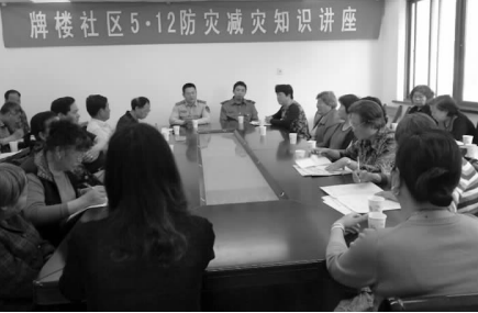
日前,安宜镇牌楼社区举办消防安全知识讲座,此次讲座特邀县消防大队相关负责人授课。