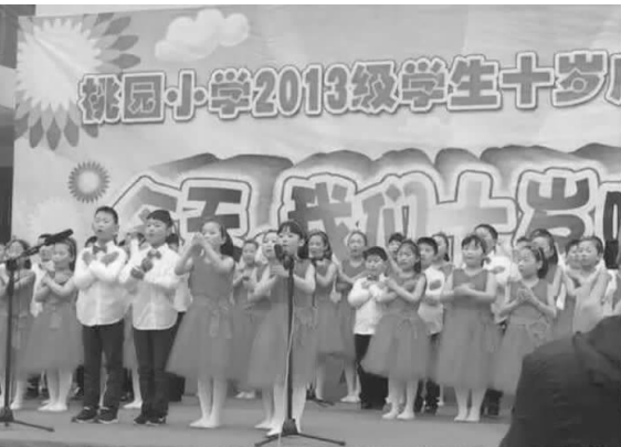
十岁,是成长过程中的一个站点,是迈向少年时期的一个关键,是心智成熟的一个开始。5 月 13 日,县桃园小学隆重举行 2013 级学生“十岁成长礼”主题活动。乔明峰/文

校园文化是学校精神财富的一种积淀,其形成和固化是一个长期的过程。伴随着学校文化的日益彰显,是张宏军“坚持+坚守”的最好诠释,汜小这所百年老校得到“水”的滋养焕发青春的活力。(吴永伟)