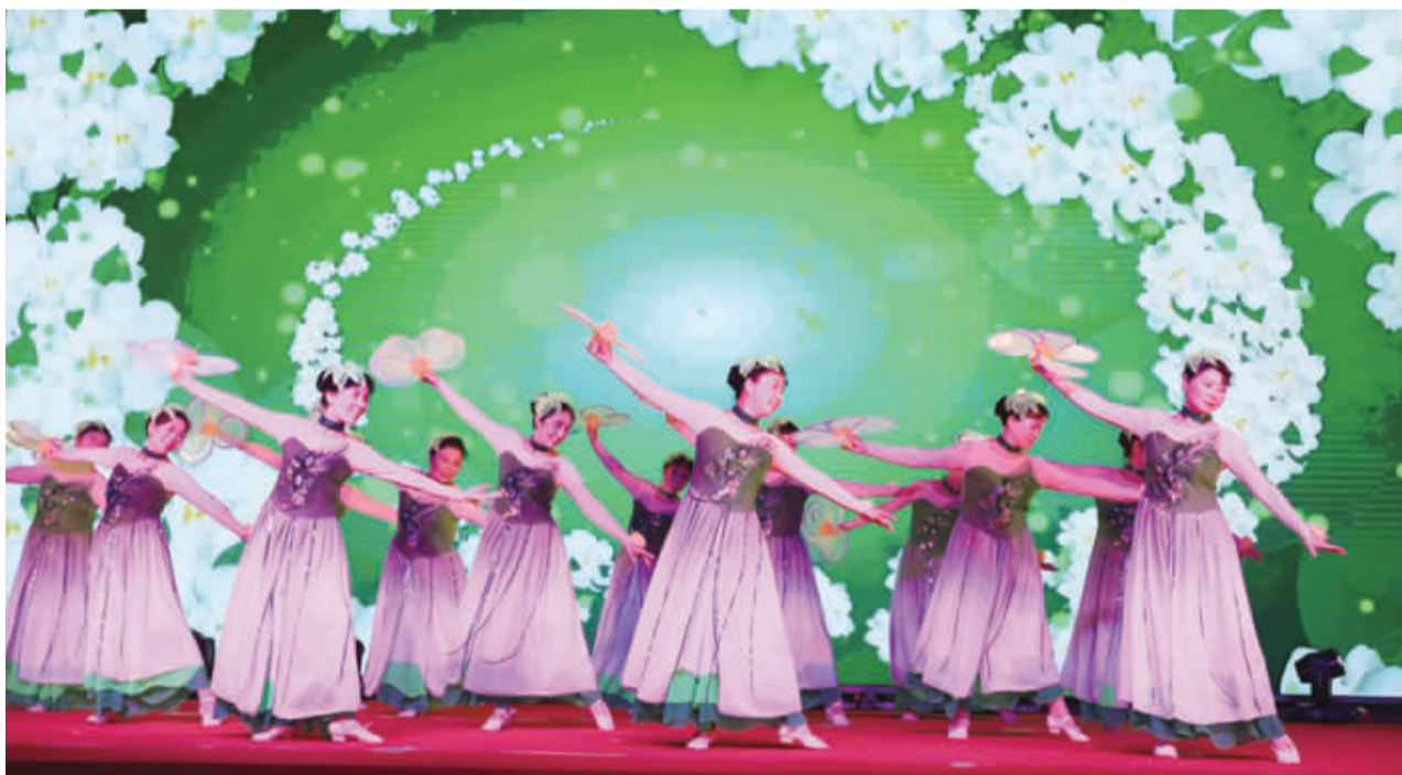
近日,由安宜镇文体站、综治办、莲花社区、郭庄社区承办的“展示新城风采、共建平安宝应”金秋文艺晚会在邻里中心举行。来自社区的文艺爱好者用歌曲、舞蹈、小淮剧等群众喜闻乐见的文艺节目赞颂平安和谐的新城家园。