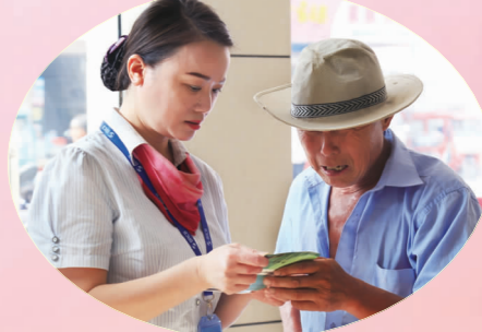
宝应农商银行提升老年客户服务水平。