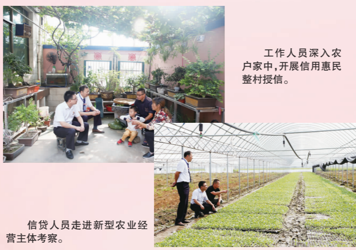
工作人员深入农户家中，开展信用惠民整村授信。