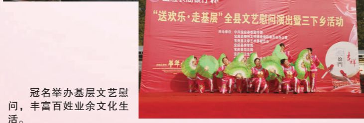
冠名举办基层文艺慰问，丰富百姓业余文化生活。