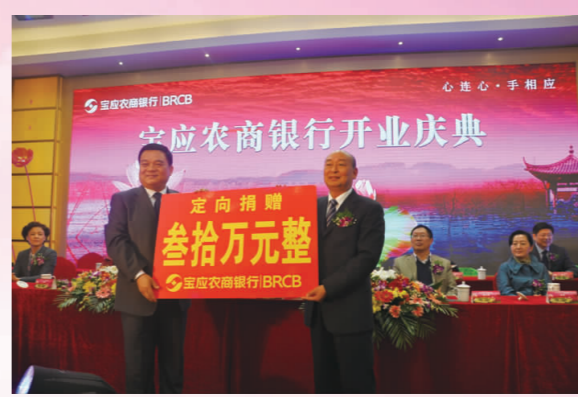
宝应农商银行一次性向县慈善总会捐赠三十万元。