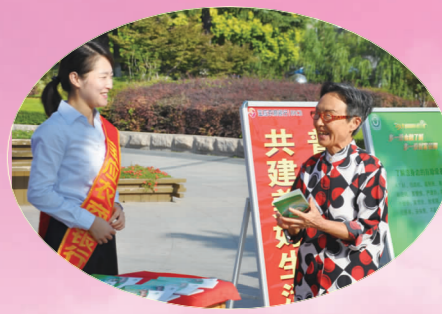
积极组织员工开展金融知识宣传。