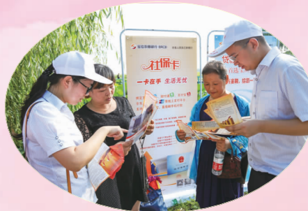
宝应农商银行深入镇村开展金融知识宣传。