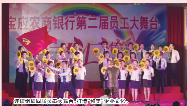
连续组织四届员工大舞台，打造“和美”企业文化。