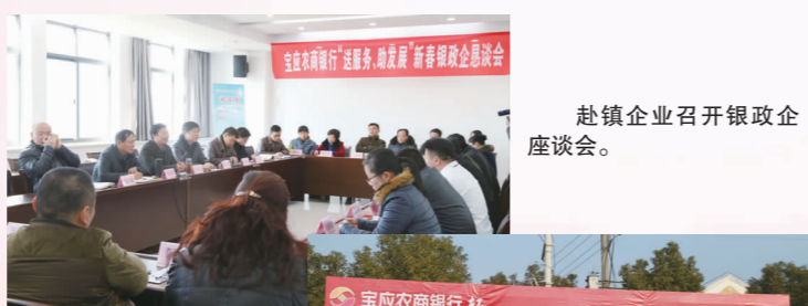
赴镇企业召开银企座谈会。