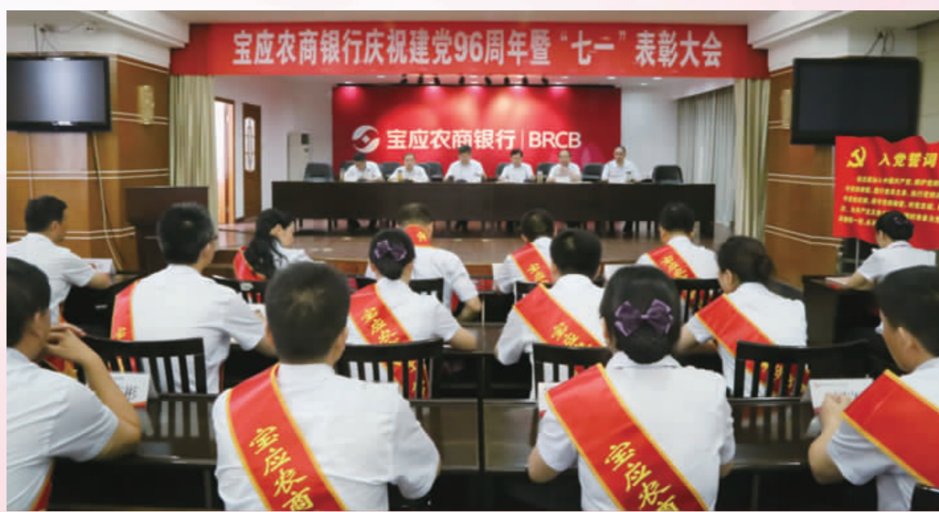
开展党建表彰，强化党建助推业务发展。