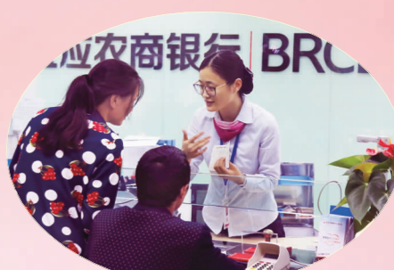
宝应农商银行实施微笑服务，提升柜面服务水平。