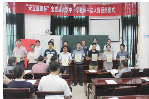
“安宜建设杯”宝应县首届中小学教师书法大赛