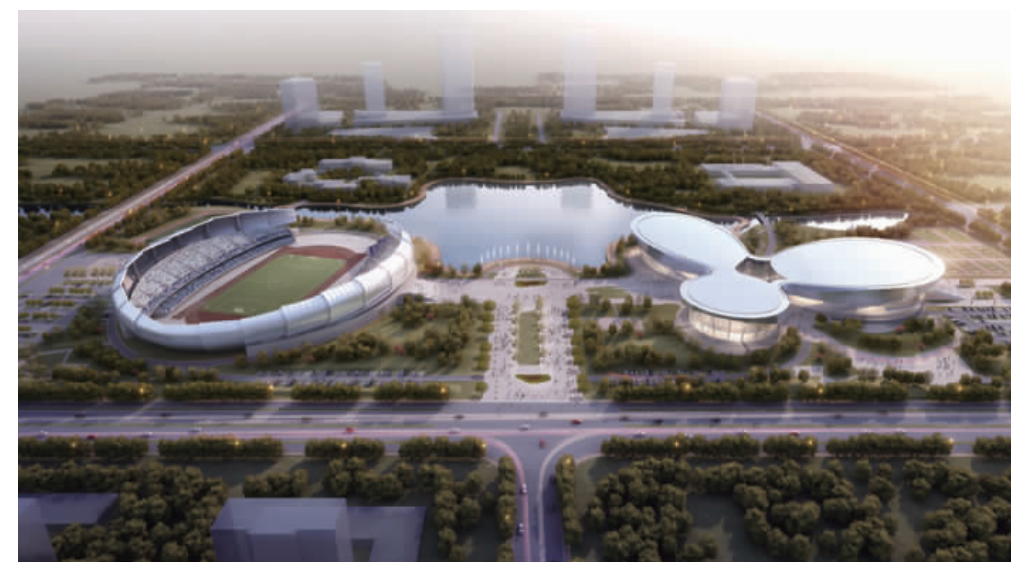
宝应生态公园项目

目前集团在建工程有:宝应生态公园项目,建筑面积28767平方米;宝应县第二人民医院项目,建筑面积43716平方米;河北东方新城二期项目,建筑面积90000平方米;内蒙古万正尚都项目,建筑面积95000平方米;山东滨河花园项目,建筑面积147000平方米;山东临沂领秀豪庭项目,建筑面积139250平方米;山东郯城广厦兰郡项目,建筑面积220000平方米;太原分公司地勘院项目,建筑面积260000平方米;无锡查桥商业广场项目,建筑面积150000平方米;西安泰地国际项目,建筑面积146000平方米;云南澜公河畔项目,建筑面积150000平方米。