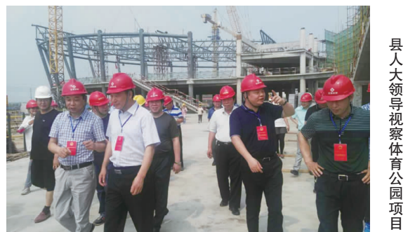
县人大领导视察生态公园项目