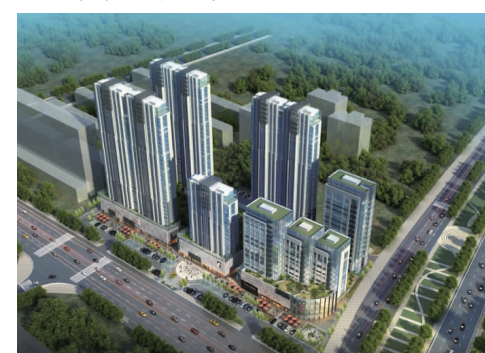
山东临沂领秀豪庭