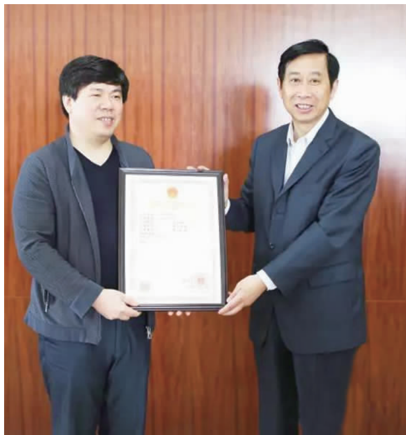
原江苏省住建厅副巡视员记迅为公司获特级资质授牌