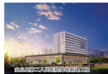
宝应县第二人民医院异地新建工程