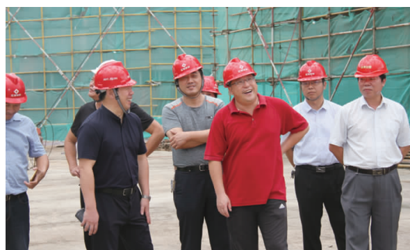
县委书记、县长王道雷视察施工现场