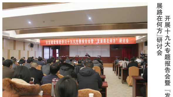
开展十九大专题报告会暨发展路在何方研讨会