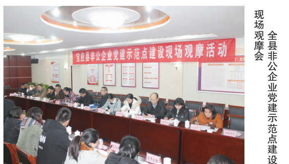
全县非公企业党建示范点观摩活动