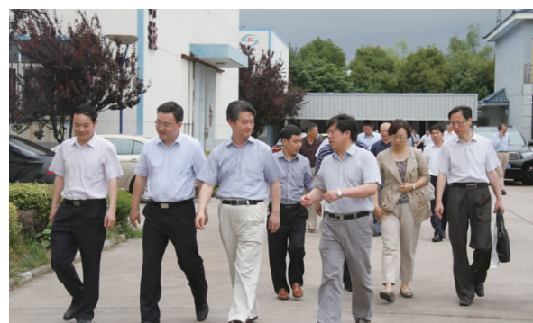
省住建厅、省经信委领导一行莅临指导工作