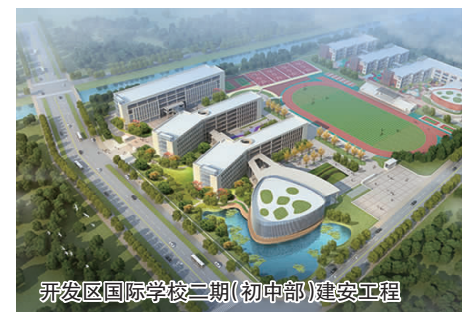
开发区国际学校二期(初中部)建安工程