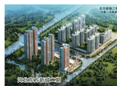
河北东方新城二期