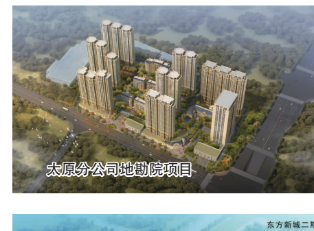
太原分公司地勘院项目