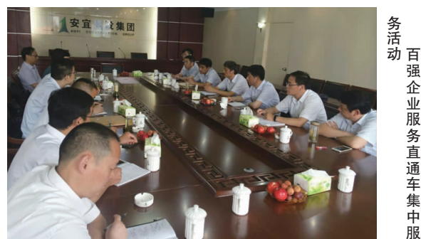
百强企业服务直通车集中服务活动