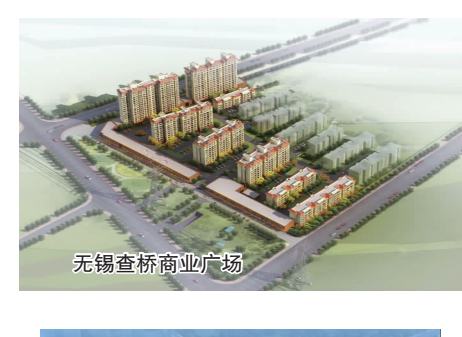
无锡查桥商业广场