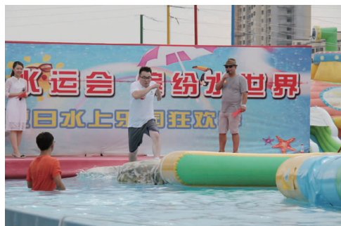
组织职工参加“水上大冲关”