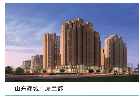
山东郯城广厦兰郡