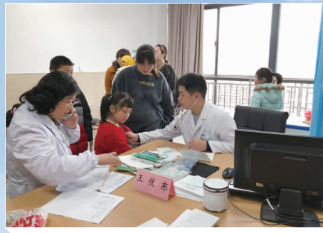
儿科专家为患儿听诊。