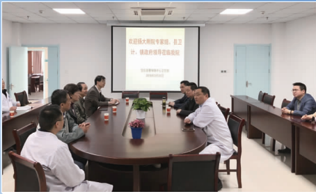
曹甸中心卫生院全体医护人员热烈欢迎扬大附院领导专家一行。