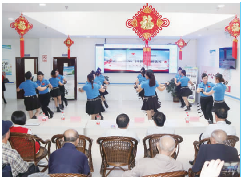
日前,县红十字会携手康蒂思志愿者协会来到海洋护理院,给老人送去很多医疗器械及生活用品,还为老人表演了精彩的节目,让老人感受到家的温暖。