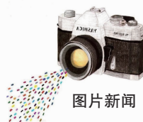
4月16日，2019年县粮食生产全程机械化育秧现场会在望直港镇狮庄村召开，各镇(区)育秧大户、种田大户、农机大户等200多人参加，现场演示了新型播种机械。

汛水 狠抓一事一议项目建设安全 本报讯 近日，汜水镇召开村级一事一议项目建设安全生产工作布置会。各村(居)委派会计、一事一议项目监督小组成员和项目经理近100人参加了会议。