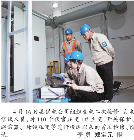
4月16日县供电公司组织变电二次检修、变电修试人员,对110千伏官庄变1#主变、开关保护、避雷器、母线压变等进行投运以来的首次检修、预试。

该课题开展了讨论,认为该课题具有较强的可行性和前瞻性,技术路线可行,并从专业角度提出了完善建议。 宝胜集团自1999年设站以来,积极开展博士后工作,相继与北京理工大学、清华大学、四川大学、中科院、哈尔滨理工大学联合招收博士后助力企业创新研发,先后获得了省“双创计划”、市“绿扬金凤计划”等资助,在我县设站企业中起到了较好的模范带头作用。