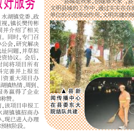
▲县行政服务中心在老水湖片区参加创建活动 ▲县武警支队在县二建片区清扫卫生 ▲县新闻传播中心在县委东大院结对共建 ▲水湖镇环卫工人夜间仍然坚守岗位清洁街道 ▲人武部在香溢花园参加创建活动

自11月2日“全县文明单位与水湖镇社区结对共建动员大会”召开后,县直文明单位迅速将会议精神落实到行动中,不少单位的主要负责人亲自来到结对社区,实地走访查看共建现场。水湖镇上下高度重视,镇党委书记每天专题调度文明共建开展情况,社居委干部采取主动登门拜访或者电话沟通的方式,与文明单位一起共同研究制定共建方案。 截至11月11日,已有23家文明单位与社居委共同研究制定好“抓教育、建设文明社区”的方案。其中县委宣传部和县党校等已经开展发放宣传资料、悬挂宣传横幅、制作共建结对牌等宣传活动。已有20家文明单位将“抓帮扶、建设和谐社区”的方案作为下一步开展活动的依据。方案内容具体,操作性强,从社区最想解决和最急需解决的实际出发,有的文明单位明确提出给社区添置垃圾桶、垃圾车等环卫设施,有的愿意给社区疏通下水道,实行路面硬化、墙体粉刷等予以资金和人力支持;有的在方案中提到开展慰问活动等。其中县气象局已经支持了6000元的共建资金用于水湖居委会下水道改造工程。还有4家单位准备依托自身资源和人才优势,将在“抓文化、建设文化社区”的共建主题中,开展群众喜闻乐见、健康有益的群众性联谊活动和知识讲座,满足社区居民精神上的需求。“抓环境、建设清洁社区”是不少文明单位共建方案中的重要内容,目前已有17家单位将此内容写进方案中。县委宣传部、供电公司、县委党校、招商局、人武部、住房建设局、文广新局、水务局、行政服务中心、县武警支队、安监局等文明单位相继在结对社区开展了卓有成效的卫生整治行动,受到了周围居民的广泛称赞。 “县城是我家,创建靠大家”,县直文明单位在推进全县精神文明建设和创建省级文明县城的工作中,通过实实在在的行动,积极展示了他们的风采,充分发挥了文明单位的示范带动作用,文明共建的暖风正在县城大地上袅袅响起。