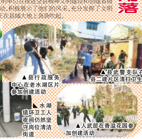
▲县行政服务中心在老水湖片区参加创建活动 ▲县武警支队在县二建片区清扫卫生 ▲县新闻传播中心在县委东大院结对共建 ▲水湖镇环卫工人夜间仍然坚守岗位清洁街道 ▲人武部在香溢花园参加创建活动

县直文明单位迅速将会议精神落实到行动中,不少单位的主要负责人亲自来到结对社区,实地走访查看共建现场。水湖镇上下高度重视,镇党委书记每天专题调度文明共建开展情况,社居委干部采取主动登门拜访或者电话沟通的方式,与文明单位一起共同研究制定共建方案。 截至11月11日,已有23家文明单位与社居委共同研究制定好“抓教育、建设文明社区”的方案。其中县委宣传部和县党校等已经开展发放宣传资料、悬挂宣传横幅、制作共建结对牌等宣传活动。已有20家文明单位将“抓帮扶、建设和谐社区”的方案作为下一步开展活动的依据。方案内容具体,操作性强,从社区最想解决和最急需解决的实际出发,有的文明单位明确提出给社区添置垃圾桶、垃圾车等环卫设施,有的愿意给社区疏通下水道,实行路面硬化、墙体粉刷等予以资金和人力支持;有的在方案中提到开展慰问活动等。其中县气象局已经支持了6000元的共建资金用于水湖居委会下水道改造工程。还有4家单位准备依托自身资源和人才优势,将在“抓文化、建设文化社区”的共建主题中,开展群众喜闻乐见、健康有益的群众性联谊活动和知识讲座,满足社区居民精神上的需求。“抓环境、建设清洁社区”是不少文明单位共建方案中的重要内容,目前已有17家单位将此内容写进方案中。县委宣传部、供电公司、县委党校、招商局、人武部、住房建设局、文广新局、水务局、行政服务中心、县武警支队、安监局等文明单位相继在结对社区开展了卓有成效的卫生整治行动,受到了周围居民的广泛称赞。 “县城是我家,创建靠大家”,县直文明单位在推进全县精神文明建设和创建省级文明县城的工作中,通过实实在在的行动,积极展示了他们的风采,充分发挥了文明单位的示范带动作用,文明共建的暖风正在县城大地上袅袅响起。