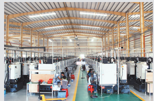
广银 CNC 数控加工中心