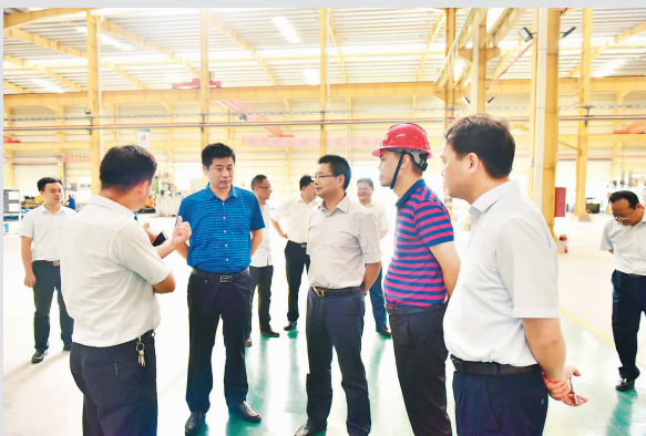
县委副书记、县长黄桦在下塘调研