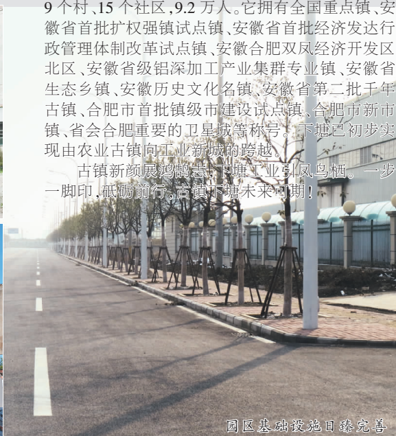
园区基础设施日臻完善