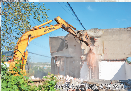
和谐拆迁,拓展发展空间