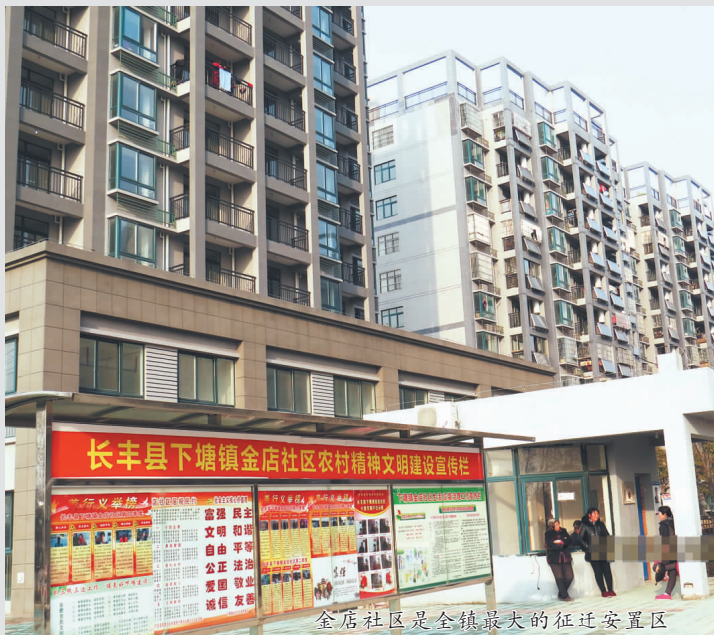
金店社区是全镇最大的征迁安置区