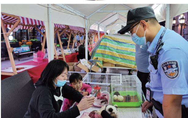
民警在摊位前查验摊主健康码。