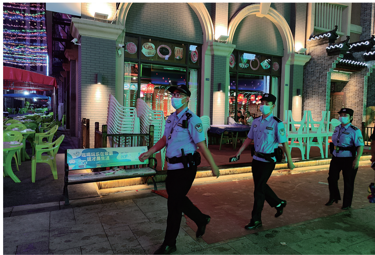
民警在帝豪老街巡查。