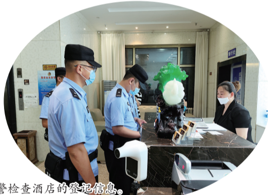
民警检查酒店的登记信息。