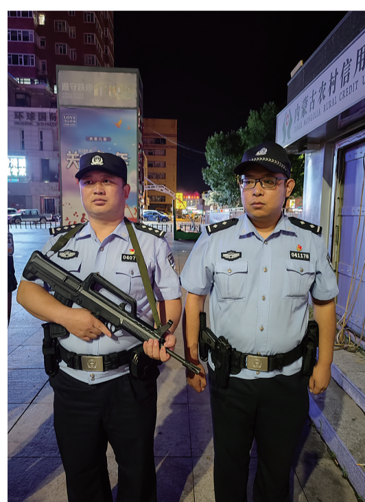
民警在维多利亚商业街执勤。