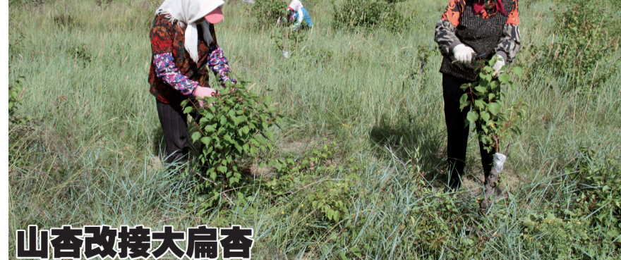
宁城县农民在田间劳作

农业现代化示范区的创建是按照粮食生产稳面积提产能、产业发展稳基础提效益、乡村建设稳步提升提质量、农民增收稳势头提后劲的工作布局,围绕守住确保国家粮食安全和不发生规模性返贫两条底线,扎实推进乡村发展、乡村建设、乡村治理重点工作,探索建立农业现代化工作体系、政策体系和制度体系,促进农业设施化、园区化、融合化、绿色化、数字化发展,为全面推进乡村振兴、加快农业农村现代化提供有力支撑。