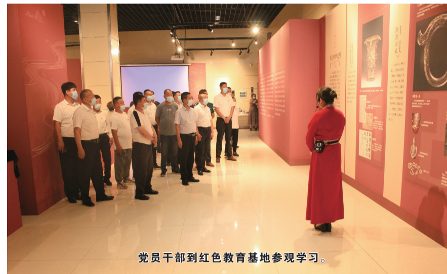
党员干部到红色教育基地参观学习。

强化基础设施投入力度，利用新型小城镇建设资金300万元，做好“美丽宝日勿苏”项目建设。争取新型小城镇建设资金100万元，对镇区地下供热管网进行改造升级。适时启动临街二层商住楼改造建设项目，规划建设翁根小区二期2万平方米住宅楼项目、305国道综合停车服务区项目，不断增加当地居民就业岗位。持续改善镇区卫生环境，严格落实门前“三包”责任制，投资402万元，确保镇区生活垃圾无害化处理填埋场项目实施并完工，积极争取焚烧厂项目建设，确保镇区环境干净整洁。聚焦治理陈规陋习，“小村规”撬动“大治理”。约定共建美丽乡村，及时清扫垃圾，倒入附近定点垃圾池；约定远离歪风，明确不搞封建迷信，不参加邪教组织，不沾染“黄赌毒”，让歪风邪气、违法犯罪没有滋生土壤；约定倡导勤俭，明确反对薄葬厚葬，抵制索取“天价彩礼”等，让勤俭节约成为共同习惯；约定促和谐，明确村民之间友善交往，和睦友好共事，让互帮互助成为生活常态；约定嘎查村两委要发挥好示范带头作用，带领全嘎查党员干部群众积极开展生产生活，带头遵守村规民约、移风易俗，推动逐渐形成家庭和睦、邻里友善等文明乡风。强化城市管理执法，加大乱停乱放、占道经营等问题整治力度，推动镇容镇貌持续改观。强化居民自治。按照《赤峰市农村牧区人居环境整治条例》要求，探索建立人居环境长效管护机制，健全完善镇区、嘎查村公共环境保洁制度，形成民建、民管、民享的长效机制。推动移风易俗，进一步完善细化村规民约，大力培育文明乡风、良好家风、淳朴民风，不断提高农村牧区社会文明程度。（张启民）