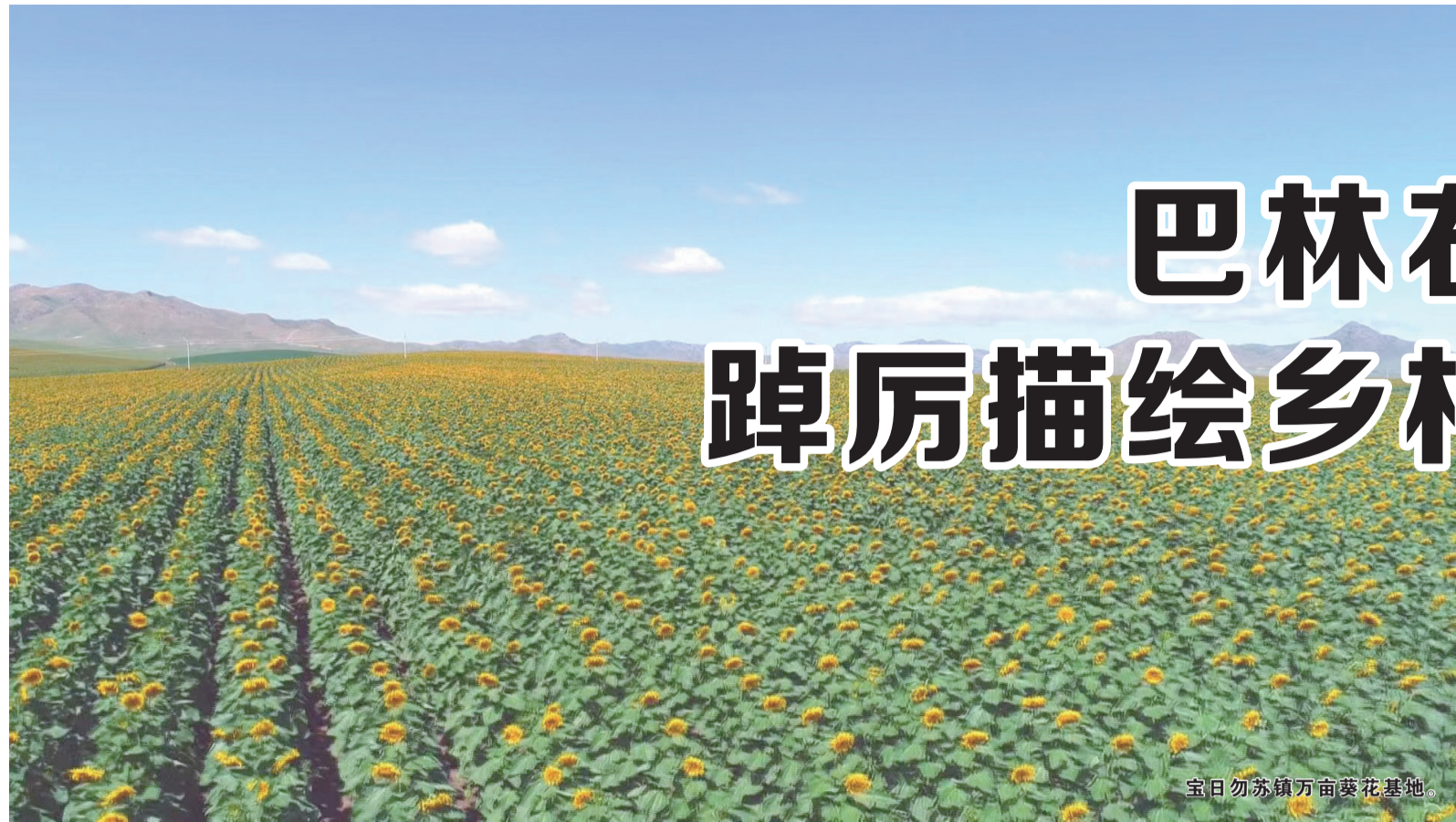
宝日勿苏镇万亩葵花基地。

深秋的巴林草原，风送爽，天更蓝。一年的劳作放飞了人们的心事，一年的硕果挤占了眼前的恬静。在习近平新时代中国特色社会主义思想指引下，宝日勿苏镇党委、政府笃定“绿色和谐、活力迸发、产业兴旺、美丽宜居、人民至上、团结奋进”的战略目标，坚持党建引领绿色发展，兴产业、富百姓，踔厉描绘了一幅乡村振兴的美丽画卷。