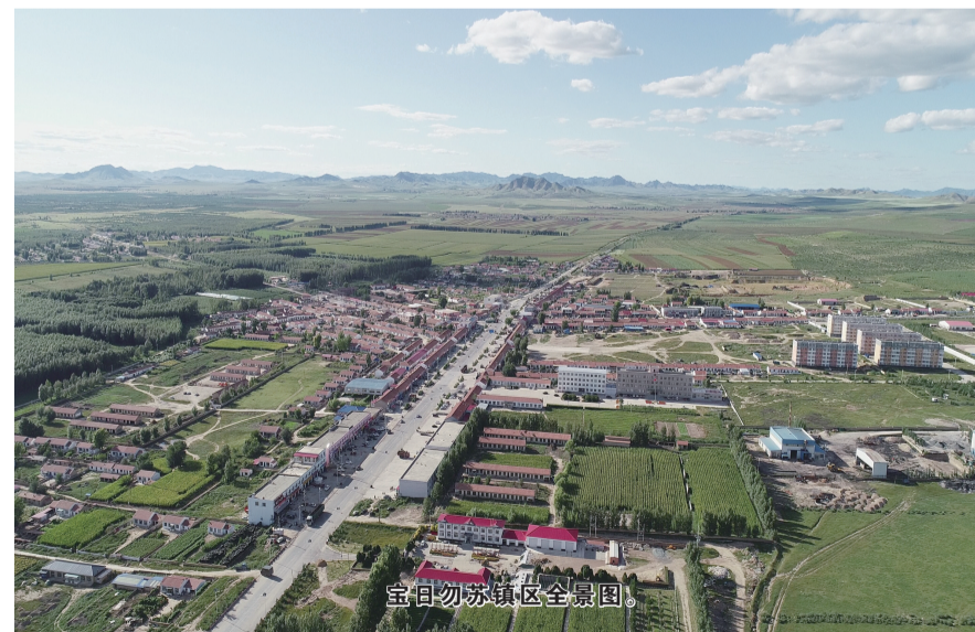
宝日勿苏镇区全景图。