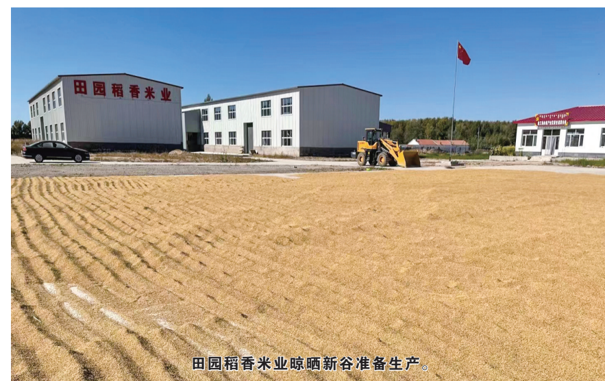
田园稻香米业晾晒新谷准备生产。