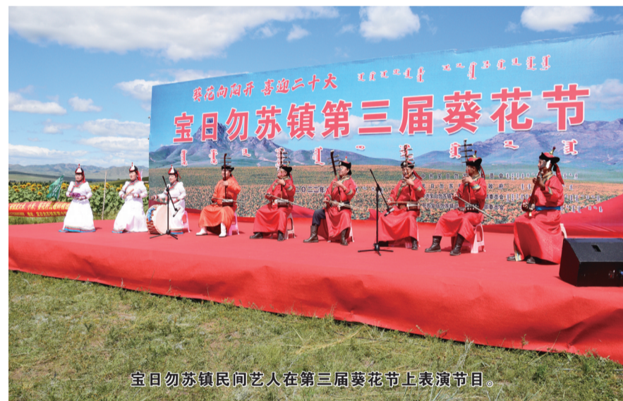
宝日勿苏镇民间艺人在第三届葵花节上表演节目。