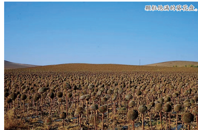
颗粒饱满的葵花盘。

葵花鲜艳炽黄的颜色与天空的纯净湛蓝形成鲜明对比，颗粒饱满的葵花籽布满花盘，随着收割机的轰鸣，农牧民辛勤忙碌的身影，脱粒机高速运转吞花吐籽，美丽的丰收景象呈现在眼前。