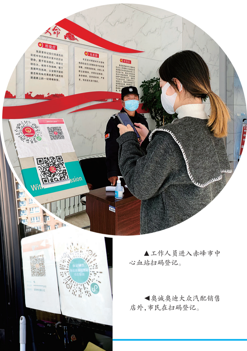
▲工作人员进入赤峰市中心血站扫码登记。