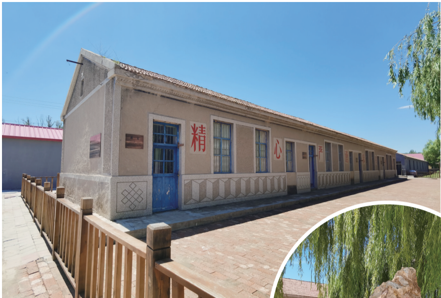
△教吉校史馆外景图。 ▷教吉校史馆外景一角。