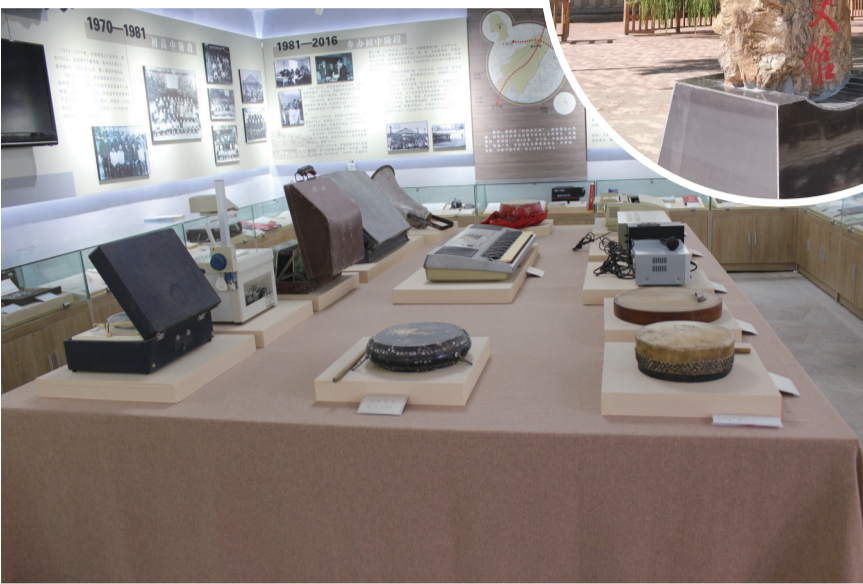
△教吉校史馆展示室内陈列的教学教具。

“传承不守旧，创新不忘本”，教吉小学地处敖汉旗牛吐镇教吉村，前身是教吉中学，始建于1959年，经历了地区初中、高中、乡办初中、小学四个阶段，六十余载的风风雨雨，半个多世纪的沧海桑田，学校名师云集，人才辈出。