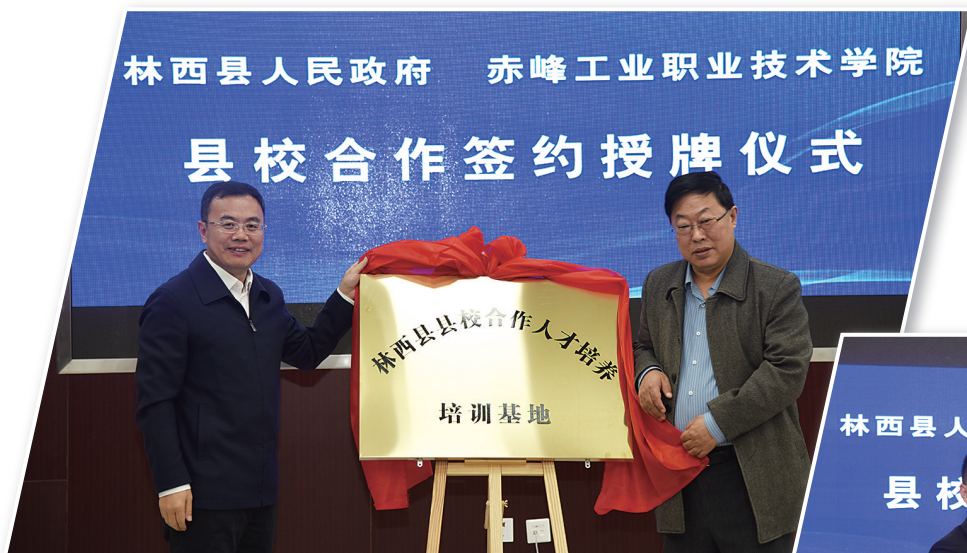
▲赤峰工业职业技术学院与林西县人民政府共同为培训基地揭牌。 ▼赤峰工业职业技术学院与林西县人民政府签订县校合作协议书。

据了解,多年来,赤峰工业职业技术学院和林西县始终保持着良好的合作关系,取得了显著的育人成效,为林西县输送了大量高素质技术技能人才。校地双方互借优势,深化合作不仅是林西县优化产业结构、实现高质量发展的需要,更是赤峰工业职业技术学院提升办学质量,实现内涵式发展的需要。校地合作协议的签署标志着双方合作翻开了新的篇章。