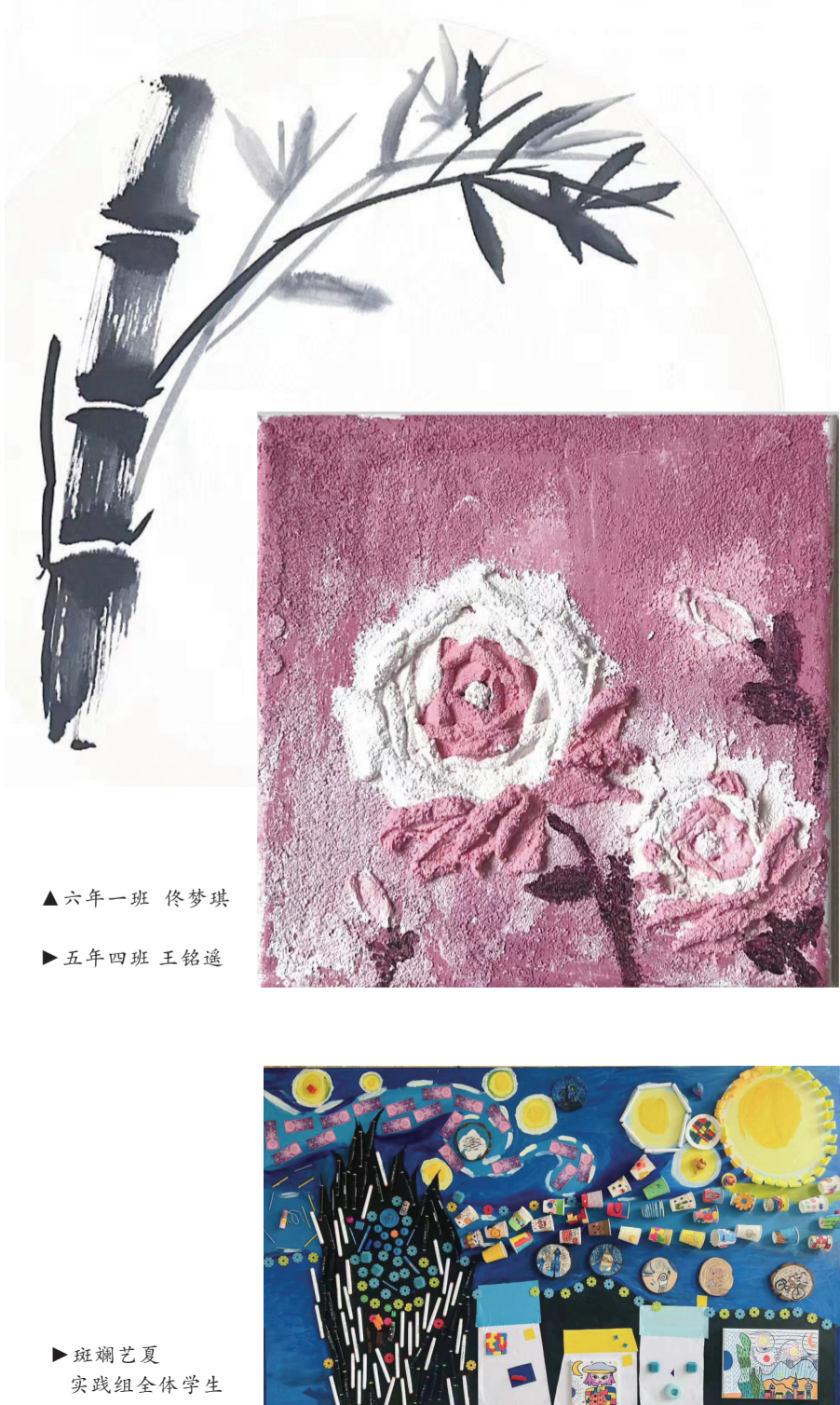
▲六年一班 佟梦琪 ▶五年四班 王铭逸