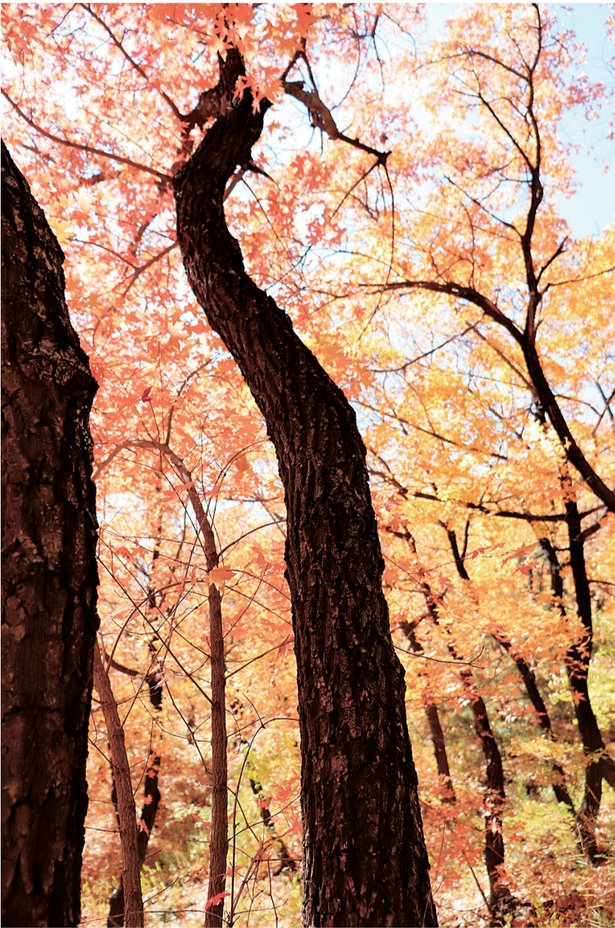
秋天的树。

阎墨，出身于书法世家，有过军旅生涯二十载。曾获全军书法比赛一等奖，在军内外获奖二十余次。 近五年来，部分书法作品被国家有关部门及个人收藏。近一年来，分别上传抖音、快手等社交平台2400余幅作品，颇受广大网友欢迎，播放量达到了800多万次，达到了切磋书法技艺、弘扬传统文化的目的，受到广大网友及书法爱好者的好评。