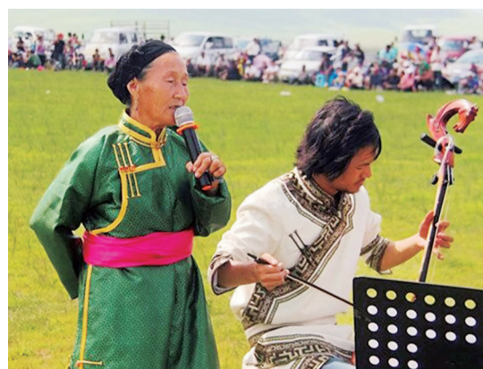
传承人在演唱巴林民歌。

左旗巴林民歌流传在大部分村落和嘎查，广泛分布于林东镇、白音乌拉苏木、乌兰达坝苏木、查干哈达苏木、查干哈达苏木的前召、后召、真寂之寺景区和白音乌拉苏木乌兰白其嘎查最为