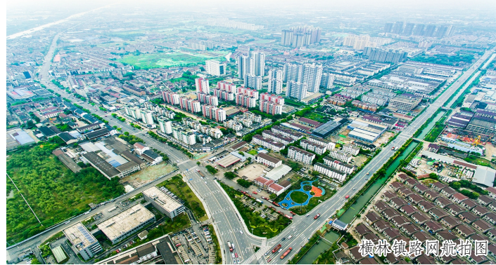
横林镇路网航拍图

曾经，横林46.68平方公里土地上，沪宁铁路、京杭大运河、312国道3条交通大动脉呈