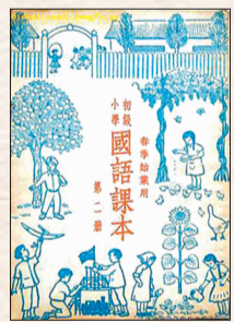
建国初期时语文课本