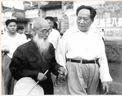
毛泽东和老师毛宇居

1950年9月,毛泽东在北京与“一师”同学周世钊谈话时说:“我没有正式进过大学,也没有到外国留过学。我读书最久的地方是湖南第一师范,我的知识,我的学问,是在一师奠定了基础。……一师是个好学校。”所以,毛泽东一直对“一师”老师尊重有加。同年12月29日,毛泽东饱含深情地为母校书写了“第一师范”的校名,并题写了“要做人民的先生,先做人民的学生”的校训。实际上,无论是求学时期、革命年代,还是在成为开国领袖后,毛泽东一直没有忘记老师的精心指点,时刻铭记着恩师的谆谆教诲,饱含着他与老师们的深情厚谊。