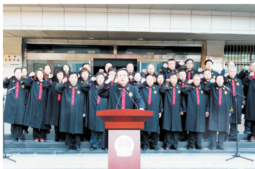
12月4日，区法院开展“12·4国家宪法日”集中宣誓仪式暨集中法治宣传活动，法官们庄严宣誓，表达了公正司法、恪尽职责、廉洁奉公的坚强决心。