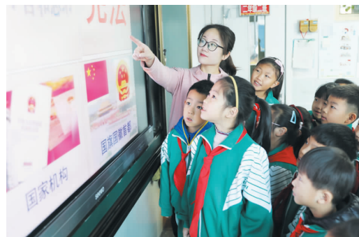
12月3日，德州市实验小学组织学生认真学习宪法知识，增强了学生的法制观念，营造了自觉学法、守法、用法的社会氛围。