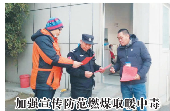
加强宣传防范燃煤取暖中毒

12月4日，振华社区对老旧小区、沿街商户、生产单位等地发放、张贴安全隐患宣传页，并对液化气罐和燃煤取暖安全使用、如何预防一氧化碳中毒等知识进行宣传普及，全面提高百姓安全取暖、用气常识和自我防护保护能力，确保大家安全取暖和用气安全。