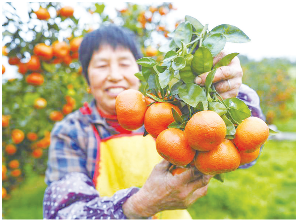
3月15日,果农在重庆长寿区双龙镇的现代农业种植园区内展示晚熟柑橘。近日,重庆长寿区晚熟柑橘喜获丰收。据了解,2016年,长寿区柑橘种植面积达30.85万亩,产量达22.7万吨。