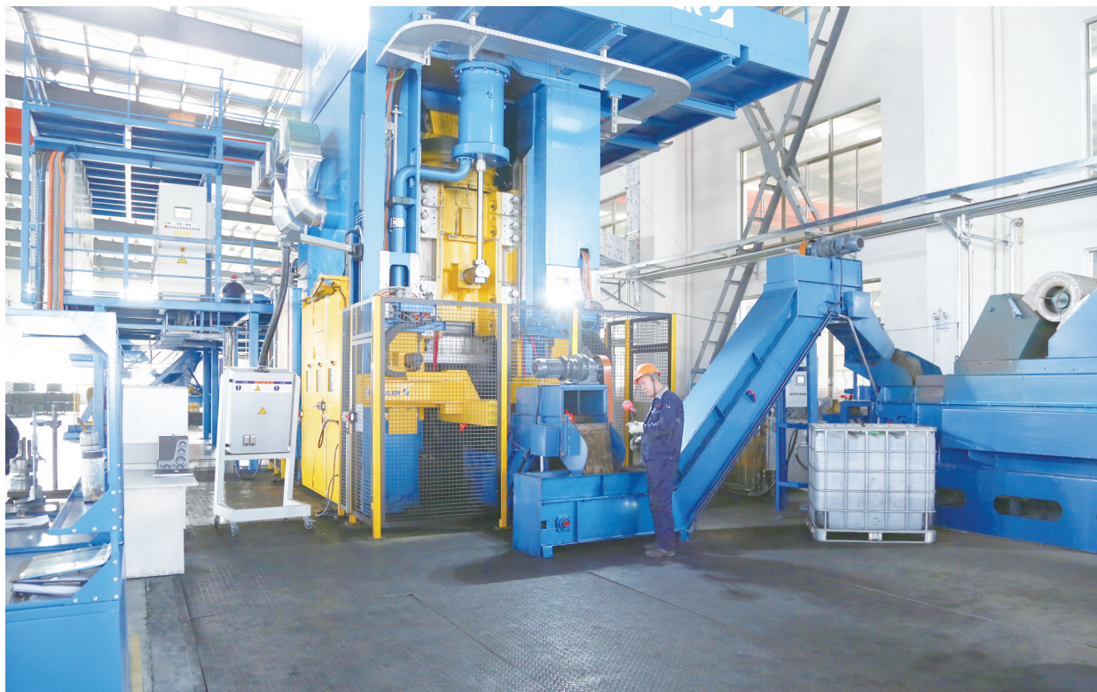
4月18日,江苏大洋精锻有限公司生产车间内,工作人员在调试设备。近年来,该公司不断加大技改投入,引进先进的生产设备,不断拓展销售市场。目前,该公司正开足马力抓紧生产,全力实现“双过半”目标任务。