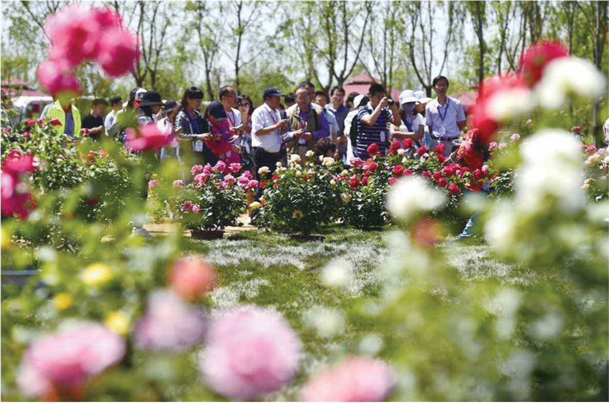
5月15日,与会嘉宾在展区欣赏盛开的月季花。当日,首届京津冀月季博览会在天津武清京津滨玫瑰庄园开幕,10万余株月季花供游人欣赏。

在促进民心相亲方面,地缘优势不可忽略。“一带一路”重点省份应当立足本省特点,开展教育领域的交流合作。比如,海南可以重点加强与海上丝路国家的交流,展开热带农业、海水养殖、旅游管理等方面的培训;新疆与俄罗斯、哈萨克斯坦等国接壤,在教育对外开放,尤其是汉语国际教育与推广上,具有区位优势。许涛表示,今后,依托重点省份的“省部共建”,将成为“一带一路”教育行动的重要抓手。去年,教育部已完成8省区的签约,今年,教育部进一步与5省1市完成签约,基本实现与主要节点省份签约的全覆盖,基本形成省部推进“一带一路”教育行动网络。(新华)