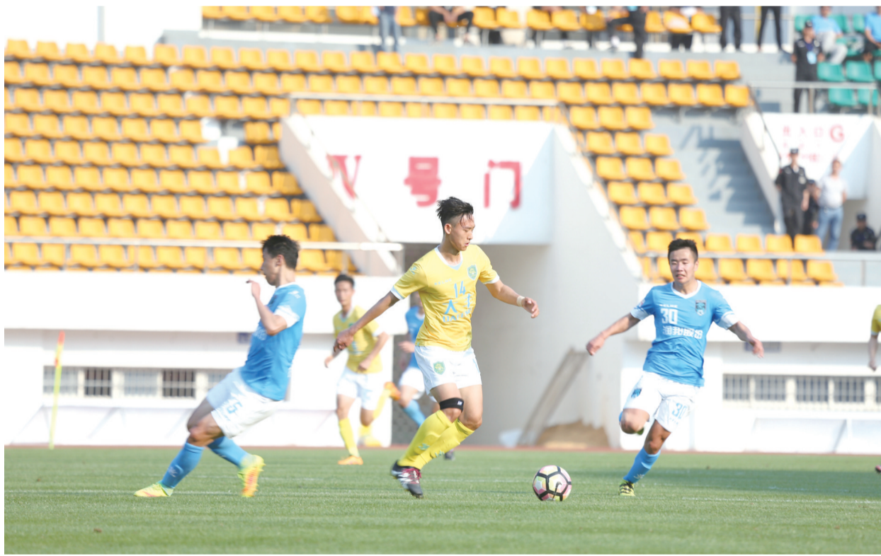
5月17日，全国第十三届运动会男子足球城市组资格赛在区奥体中心足球场举行，由盐城大丰队对阵南通支云队，双方队员在绿茵场上经过90分钟的激烈对攻，最终盐城大丰队以4:0取得胜利。

该镇立足防大汛、抗大旱、抢大险、救大灾，将可能发生的汛灾和旱灾分级处理，把相关职责进行明确分工，实打实进行防汛抗旱部署，构建起防汛抗旱群防体系。修改完善出台新的防汛抗旱应急预案，组建200多人的抢险突击队，落实防汛抗旱经费，添置铁丝、木棍、蛇皮袋等防汛抗旱物资。对抢险组、器材组、保障组、服务组进行突击检查。对辖区内的河、沟、塘、渠等水利设施全部落实到具体人员。突击清除中沟坝埂和水面障碍物380多处，对50多处闸、泵、站进行维修。向群众发放《避灾自救手册》8000多份，提高群众防灾自救能力和防灾、避灾意识。（冷亚妍 程旭全 季俊华）