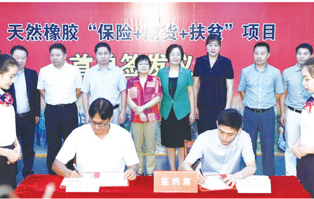
6月1日,在海南人保财险大厦,海南省白沙县政府与中国人民财产保险股份有限公司海南省分公司签订国内首笔以保障农户橡胶价格为保险标的的保单。当日,由海南保监局督学力促的海南天然橡胶“保险+期货+扶贫”项目,在海南省白沙县落地。该项目的技术核心是用期货的期权,锁定胶农预期天然橡胶的目标价格,通过投保的方式将其风险转嫁给保险人,当橡胶市场价格下跌时,胶农可获得经济补偿,从而实现稳定橡胶生产发展的目标。目前,海南省有橡胶园813万亩,全年干胶产量36.11万吨,占全国总产量的42%。(新华)