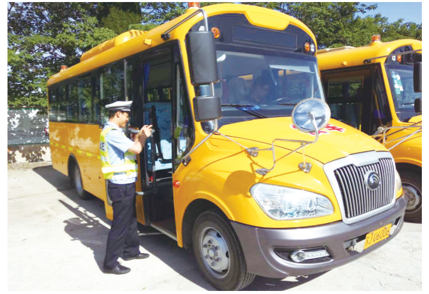
6月12日是校车、接送学生车辆专项整治全省统一行动日。图为大桥交警大队民警深入草庙小学检查校车安全设施、了解校车运行情况。

此次活动竞赛内容以《盐城市加强中小学语文和英语课外阅读指导意见》、中小学各学段推荐书目和小学语文教材中涉及到的重要作家作品以及《语文课程标准》规定的相关阅读书目等。竞赛总分为100分,以选择、判断、填空为主,适当加些体会类的题目。竞赛时,学生积极思考,奋笔疾书,娴熟答题,显示出平时阅读的主动性、广泛性。赛后,教师分年级组进行阅卷,同时根据竞赛成绩评出学校的“阅读之星”。此次竞赛,是对全体学生阅读效果的一次检验,进一步培养了学生的阅读意识,激发了学生的阅读热情,同时也把“读书节”展示活动不断推向深入。(姜红梅 杨广宇)