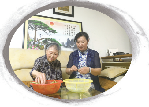
婆媳二人剥黄豆,其乐融融