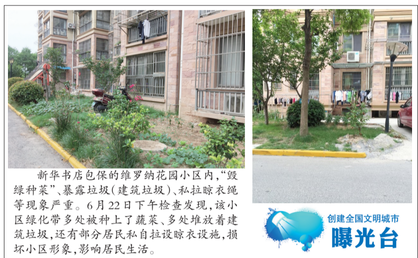
新华书店包保的维罗纳花园小区内,“毁绿种菜”、暴露垃圾(建筑垃圾)、私拉晾衣绳等现象严重。6月22日下午检查发现,该小区绿化带多处被种上了蔬菜,多处堆放着建筑垃圾,还有部分居民私自拉设晾衣设施,损坏小区形象,影响居民生活。