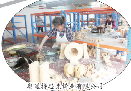
奥通特思克铸业有限公司

勇于冬泳不是盲目“下水”。企业经营者们,越是在困难的时候,越应该冷静思考,自己到底能做什么,应该往哪里走。变革的大潮中,很多时候没有前路可循,没有现成的道路可走。采访中,有企业家说,不知道怎么走的时候,就停下来,出去转转,到产业最先进的地方去学最先进的技术。正是这种瞄准先进的方向,谨慎探索、小心前行,帮助不少企业摸着石头过河,趟出了一条新路。这种试路的核心思想有两个:一个是宁不甘踏步、执着前行的勇气,一个是坚守自主创新的理念。勇于“冬泳”,加快自主创新,催生新的市场、新的增长点,找到刺激经济复苏最能产生直接拉动作用的关键环节,着力攻克核心和关键技术,创造新的市场需求,那么就在寒冬中学会了“冬泳”。不仅仅是阀门产业,任何产业和企业,只有在“危”中找“机”,才能找到正确的过“冬”方式,寻着到这缕阳光,必然能迎来发展的艳阳天。(杨燕)