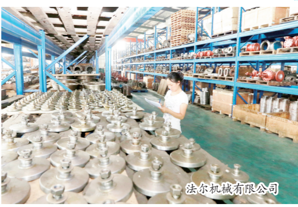
法尔机械有限公司

尽管产业革新的步伐不断加快,但阀门产业的特殊性还是决定了短时期内难以完全实现机器换人。企业发展如何甩开包袱轻松上阵,还得“两条腿走路”。该镇一方面引导企业和行业技术创新的同时,积极加强劳动力市场规划与建设,营造良好用工环境。不少企业经营主希望,政府部门能够出台更多有针对性的金融帮扶政策。据悉,区经信委正推出一种全新的小额贷款形式,南阳已被列入试点之一,更多资金将流向这里,滋润企业茁壮成长。(杨燕)