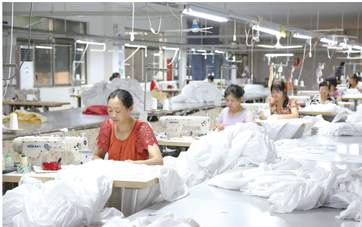
8月17日，三爱家纺有限公司生产车间内，工人在赶制销往美国的订单。今年以来，该公司协调生产要素，强化指标分解，落实激励措施，积极开拓国内外市场，争取提前完成各项任务。目前，生产订单已排至10月底。