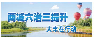
两减六治三提升 大丰在行动

本报讯 连日来,大中镇恒南村持续升温加压,全力推进“263”专项行动各项工作,以新气象、新面貌展示整治成效,得到群众一致好评。