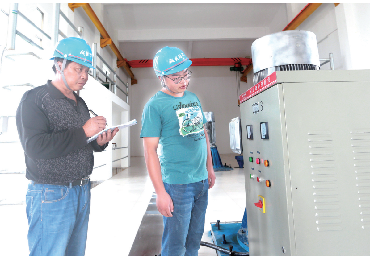
9月5日,在大中镇阜裕泵站,工作人员在记录泵站运行情况。该泵站地处阜裕河与疏港航道交汇处,是城区防洪排涝提升重点工程。