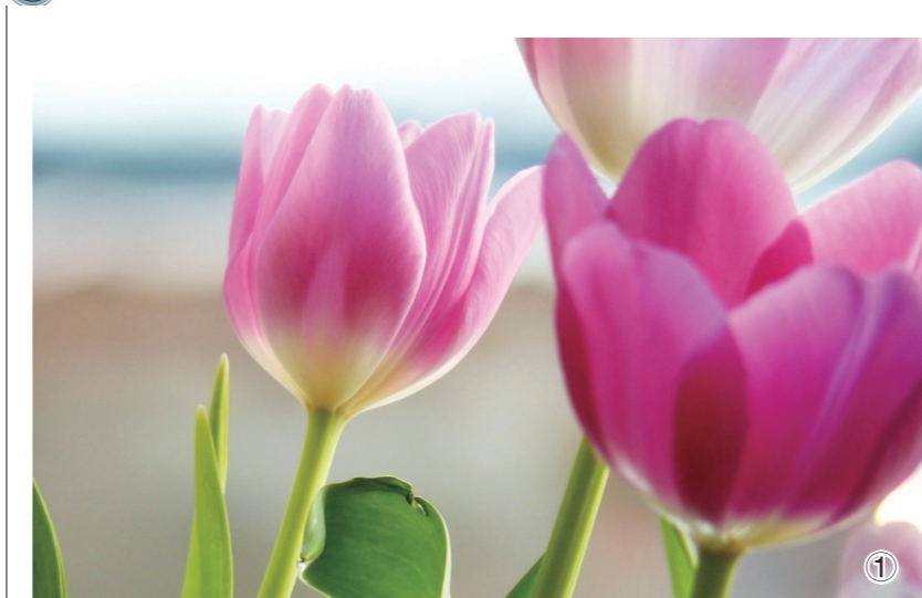
① 红粉