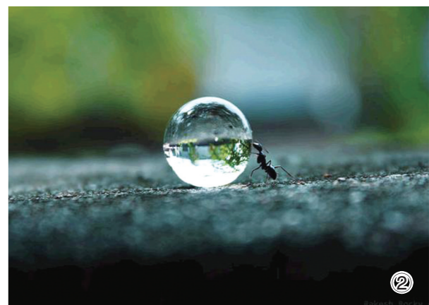
② 露水