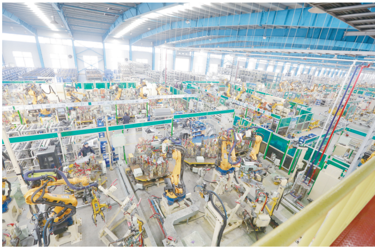
12月11日，新韩汽配有限责任公司生产车间内，工作人员正操作机械臂加工汽车零部件。该公司焊装车间内350台机械臂全部采用多车种共线柔性化生产模式，可完成多款车型零配件的焊接。截至目前，该公司已完成销售4亿元。

本报讯 日前，省家庭医生签约服务创新举措现场复评会在南京召开，区卫计委《个性化签约，全方位保障，引领家庭医生制度健康发展》获“2017年度江苏省家庭医生签约服务十大创新举措”。 我区自2013年6月启动家庭医生签约服务工作以来，围绕高血压和糖尿病等重点人群进行健康管理，加快形成政府主导、部门协作、社会参与的政策机制，率先探索将基本医疗卫生服务与个性化延伸服务相结合、个人付费与医保付费相结合、群众健康需求与基层卫生服务供给能力相结合的新型签约模式。针对老年人、儿童、慢性病患者等不同人群，我区遴选针对性强、认可度高、实施效果好的个性化服务项目，受到了群众、医务人员的认可，全区目前个性化有偿签约7.8万户，签约率28.9%，高血压、糖尿病等重点人群签约率达到56%；续约率保持在91%左右。 (记哉)