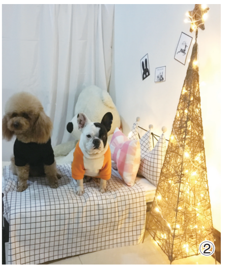
② 过节