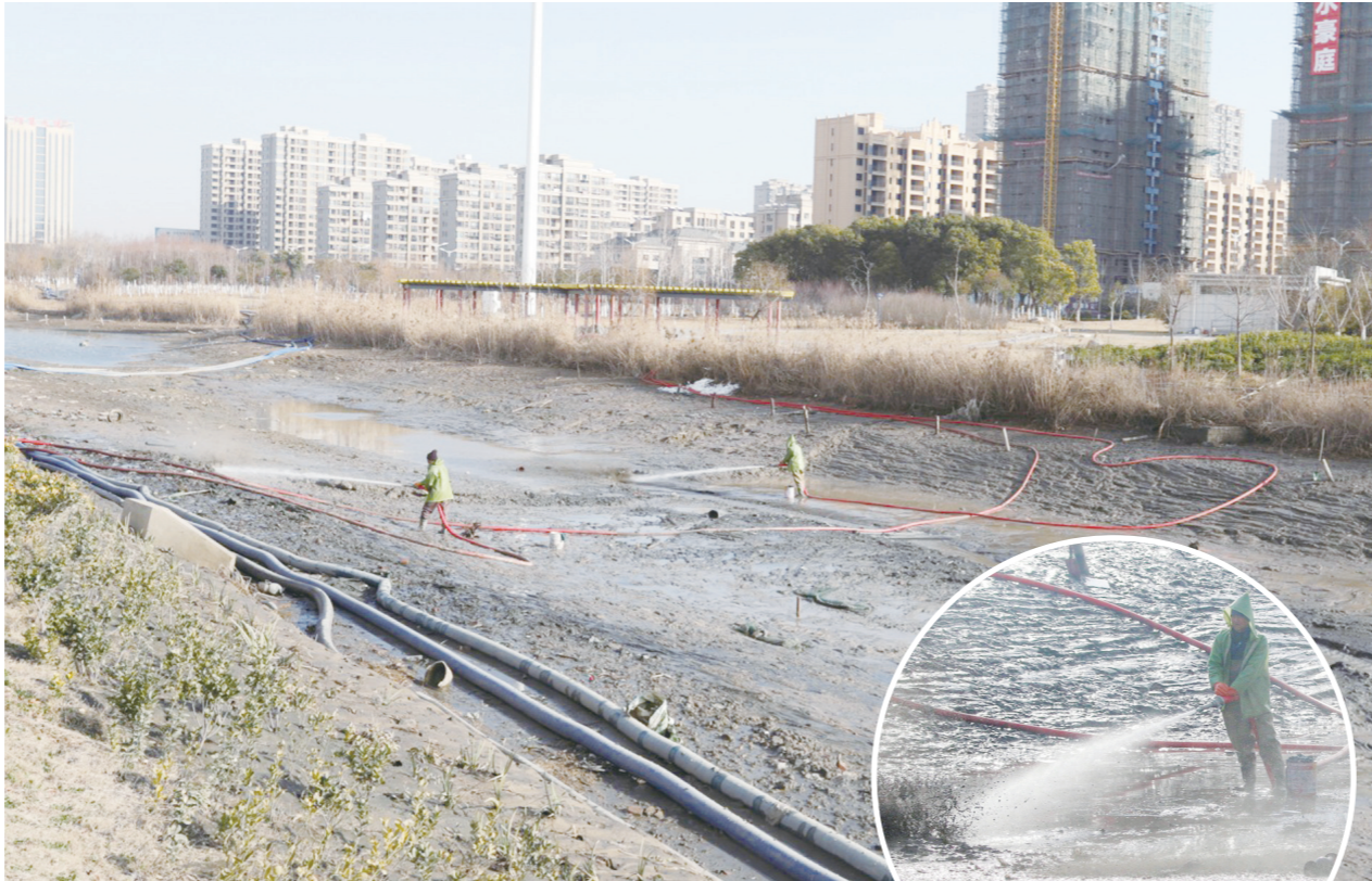
1月14日，五一河工程疏浚整治现场，工人们正在疏通河道。入冬以来，各镇以农村河道生态治理为重点，以全面推行河长制工作为抓手，精心组织，规范操作，夯实措施，快速推进，掀起了加快水利建设新高潮。