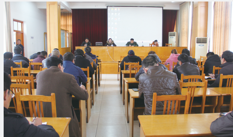
日前,区住建局开展建筑工地消防安全培训。该局邀请消防大队等单位的专家对全区在建建筑工程安全负责人和项目经理进行了消防安全知识培训。消防专家对重点防火部位设备配置及定期查验、工程各部位需配置消防设施具体要求、民工宿舍用电安全等内容进行了详细讲解。