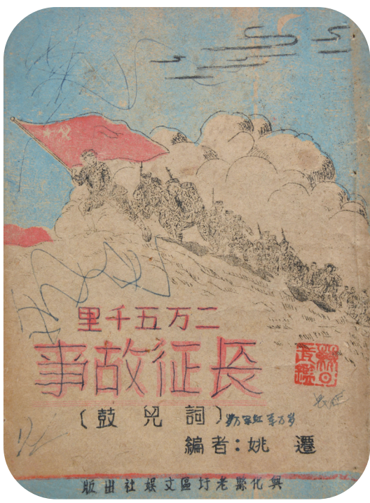
《长征故事（鼓儿词）》封面照片

名。附记称作者是民歌、小曲的爱好者，采用兴化水乡民间鼓词编写《长征故事》，完成前四段后，曾在兴化县刘庄区民兵大会上演唱，曲本全部写成后，即由刘庄流动宣传队到各乡演唱，为群众所欢迎，后刻印散发。时间是10月31日，缺少具体年份。曲本现收藏于镇江博物馆。