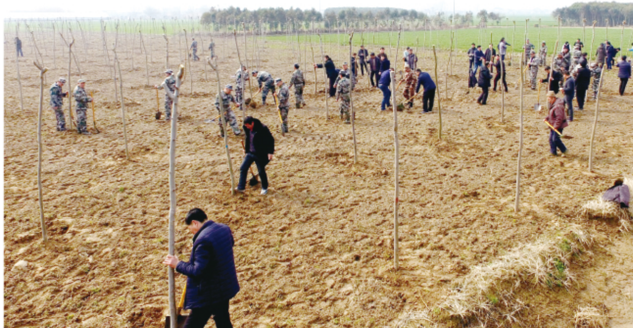
昨天上午，万盈镇组织机关事业单位全体工作人员近200人，来到兆丰村陈李线西侧参加义务植树活动。截至目前，该镇已新建成片造林850亩，其中防护林650亩、经济林200亩，新建高标准农田林网3000亩；森林村庄公共绿地已开工建设；全镇共栽植苗木3万株、果树3万株、其他树种近12万株。