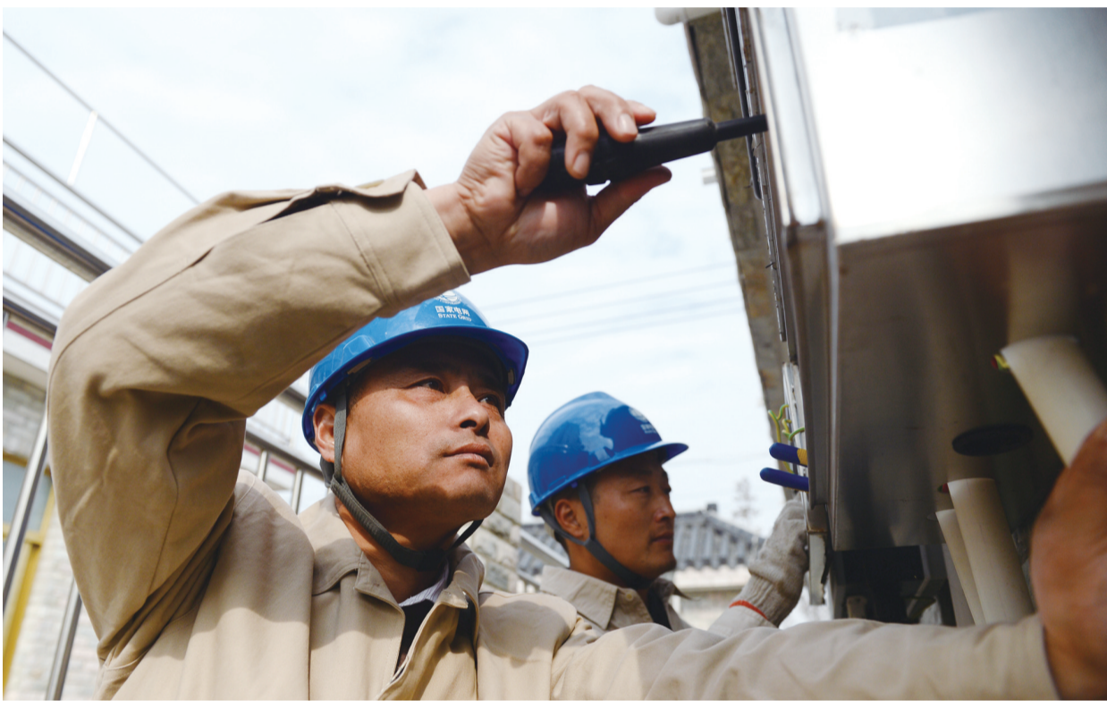
日前,区供电公司工作人员在恒北村进行光伏发电板的安装。今年以来,该村鼓励农民使用绿色新能源,除在第一批集中居住区安装扶贫光伏发电装置外,又有100多户周边农民安装小型屋顶光伏发电板。

心”工作机构,进一步聚焦教学质量,聚合骨干力量,聚力机制创新。三龙小学“感恩教育”建成省级课程基地,万盈初中省级课程基地项目通过专家组中期评审,全区省级课程基地项目达10个,“珠算项目工作室”建成盐城市服务地方产业领军人才工作室。完善城乡校长教师交流轮岗制度,14名校异地交流任职,99名农村教师安排到城区学校顶岗任教和跟岗学习。精心选聘了60名第二届中小学(幼儿园)责任督学,采取专职督学与兼职督学相结合、常规督学与随机督学相结合、专题督学与综合督学相结合,有力提升了督学质量。合作开放力度持续加大,与中国科学院神经科学研究所、苏州外国语学院、苏州彩香中学签订了合作办学协议,成立了盐城市商贸产业职业教育联盟。(徐雪)