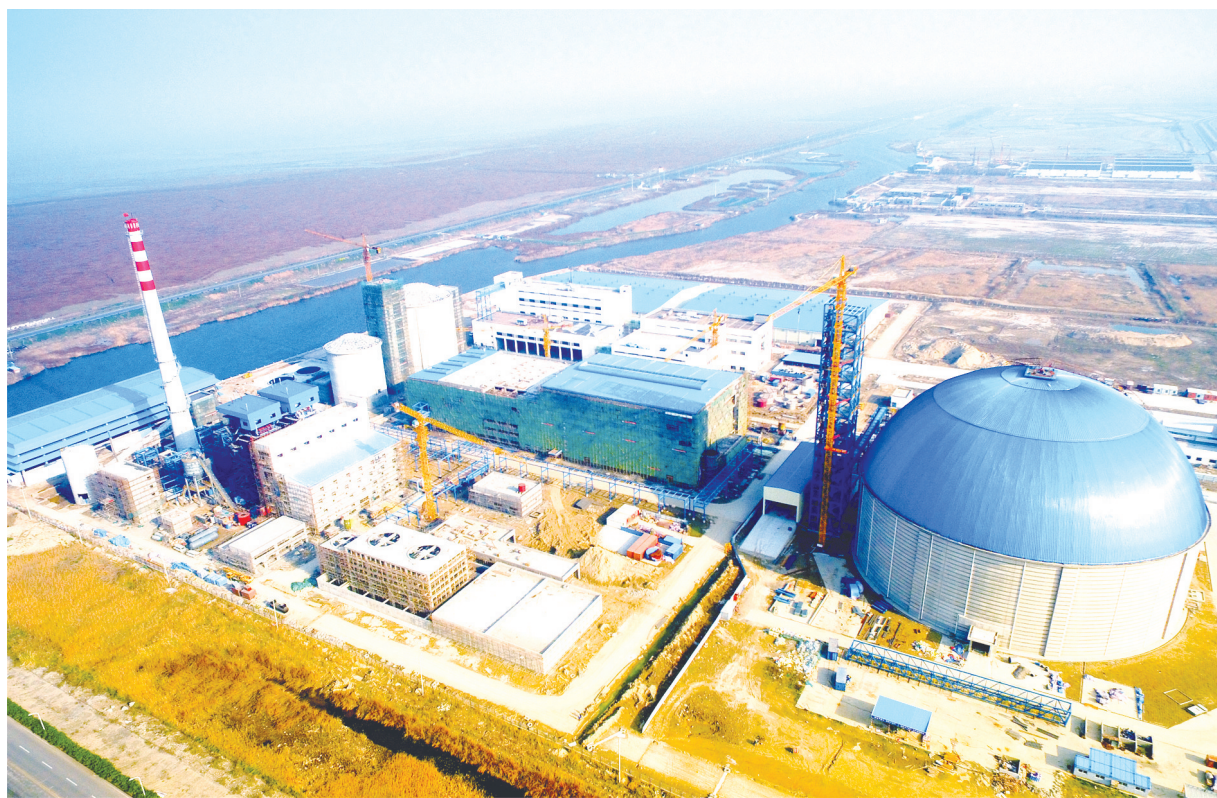
近日，英茂糖业建设现场一片繁忙施工景象。据悉，该项目主体厂房已基本建成，筒仓已完成封顶，即将进行设备安装。目前，该项目正全力以赴加快建设，确保下半年竣工投产，全部达产达效后可实现年产值50亿元。

建立防汛领导机构。该镇恢复防汛组织机构，镇长担任防汛指挥部指挥长，分管农业的副镇长任副指挥长，通过机构的建立健全，分解防汛任务，做到守土有责。成立抢险基干班。成立抢险基干班22个，每个村均成立抢险基干班和预备抢险基干班，抢险人数达到880人。搞好排泵泵房维护。保养维护排灌站135台套，维护并试运行排灌站设施35座。同时加强堤防管护，对险工险段进行检查加固，对相关村落实维修措施，确保硬件安全度汛。搞好防汛物资储备。该镇拿出8万元购置和维修排灌泵，同时由镇水利站和各村储备蛇皮袋5万只、木桩3000根、绳索200公斤、铁丝300公斤等物资。该镇还通过加大考核力度，督查各村拆除障碍物与坝埂等阻水物，各村境内的河道疏浚工程在汛期前全面完成，确保安全度汛。 (吴耀庭 姚晓明 练永健)