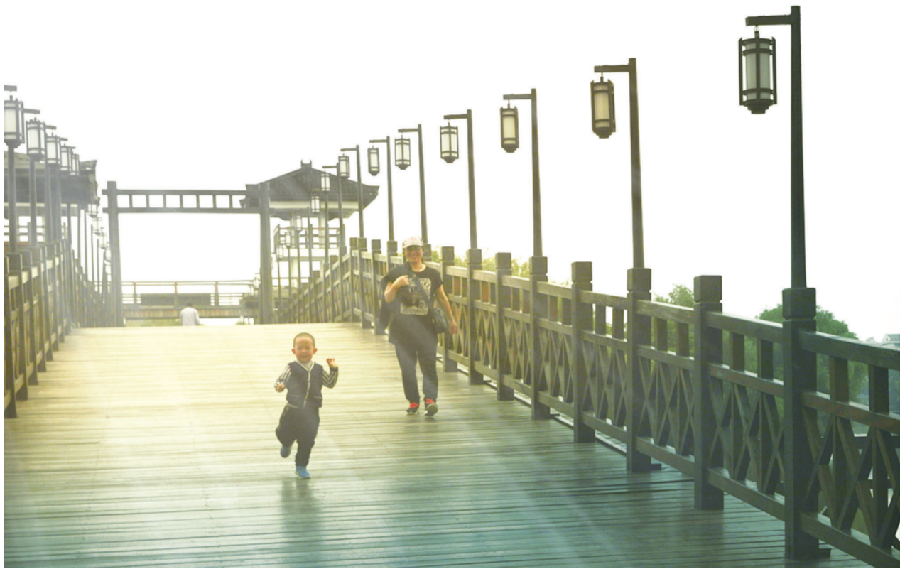
5月29日,游客在白驹镇中华水韵园景区内的施耐庵纪念馆游玩。今年该镇深挖特有的水韵文化资源,精心打造水韵文化特色小镇,开发乡村旅游,建成国家3A级旅游景区,吸引了海内外游客前来旅游观光。