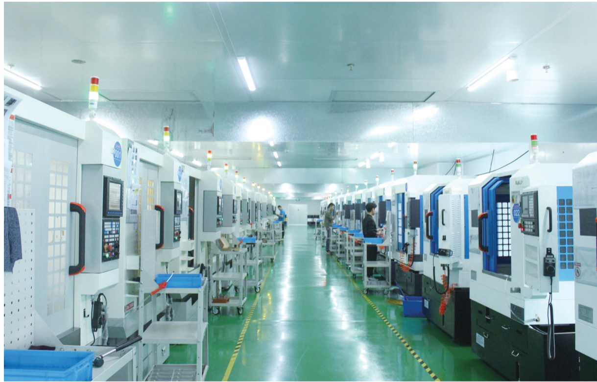
6月14日,江苏道融精密组件有限公司车间内,工作人员操作机器生产精密零部件。该公司投资1.5亿元,专注于精密电子防水零部件、手机防水结构件生产,全部投产后年销售可达5至8亿元,目前正积极扩大业务,提高市场占比。

该镇高度重视生态环境的建设和保护,给百姓最大的生态环境民生幸福。进入夏收后,该镇立即部署全镇禁烧禁抛工作。镇三办领导、机关干部全部沉入一线,现场督察落实夏季禁烧禁抛和农作物秸秆综合利用工作。镇主要负责人深入村口地头河边,宣讲绿色健康生态发展政策,督查整改乱排乱放、乱堆乱抛等破坏生态环境的违法违规行为,主动和各分工村居基层干部群众一起,参与清运堆积的垃圾杂物,打捞河道水生植物和漂浮垃圾。截至目前,全镇8.5万亩小麦、3000多亩油菜、蚕豆全部抢收结束;300多台套秸秆还田机、免耕条播机配套运用促转化,秸秆还田利用率达96%以上;600多吨未能还田利用的蚕豆、油菜秸秆被集中拖运至秸秆收储点循环利用。8条区级、33条镇级、56条村级河道已突击整治多遍。依法拆除了新增禁养区的9户规模养殖场,对全镇适养区的各类养殖场集中进行规范整改。(董汝涛)