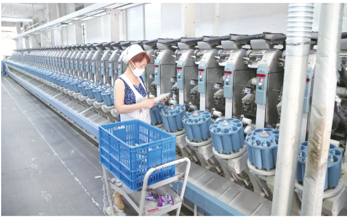
7月6日,海悦纺织有限公司生产车间内,工人在赶制订单。连日来,该公司围绕目标抓落实,大干当前争主动,努力扩大生产总量,保证客户订单第一时间完成,同时主动出击,寻求大客户,开拓新市场。