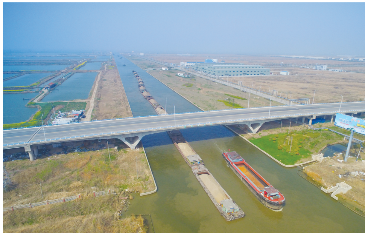
9月5日，俯瞰疏港运河四级航道，来往船舶络绎不绝。今年下半年，港区大力拓展内陆腹地，继续向皖北、豫南等地布局“无水港”内陆节点，进一步完善内河集疏运体系，构建海河联运新格局。

本报讯 近年来，草堰镇在发挥自身优势的同时，积极创造优势，突出“项目为王”，加大招商力度，招商引资成效明显。9月8日，苏州客商来到省道“351”连接线的镇工业园区，考察投资包装周转箱生产项目，对草堰的交通、人文等环境非常满意，决定到草堰投资。 该镇积极提升人文环境，以古镇特色为基础，打响旅游品牌，增强招商的吸引力，梦幻迷宫已获得了两项吉尼斯世界纪录。同时突出交通优势，投资2200多万元建成了双草公路与省道“351”的连接线，实现园区与省道、国道、高速公路的无缝对接，让交通优势更优，并成为草堰招商引资靓丽的名片。近年来该镇先后招引重组等项目12个，为全镇经济社会发展创造了条件。 (周汉明)