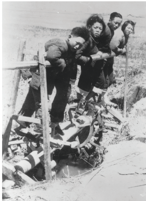
碌水车(上世纪70年代)