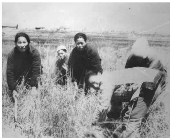
人工收割(上世纪70年代)