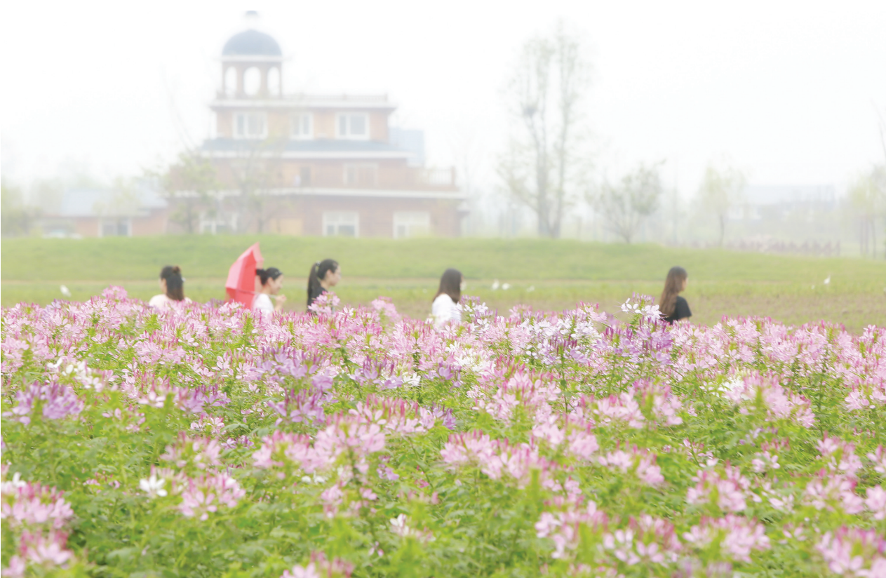
9月19日,万盈天池湖度假村内,游客在薰衣草庄园里游玩。日前,该园近百亩格桑花、醉蝶等花卉相继开放,五彩斑斓的花卉在微风吹拂下摇曳多姿、香气扑鼻,吸引了众多游客来此观赏拍照,感受花海田园风光。 单培泉 报