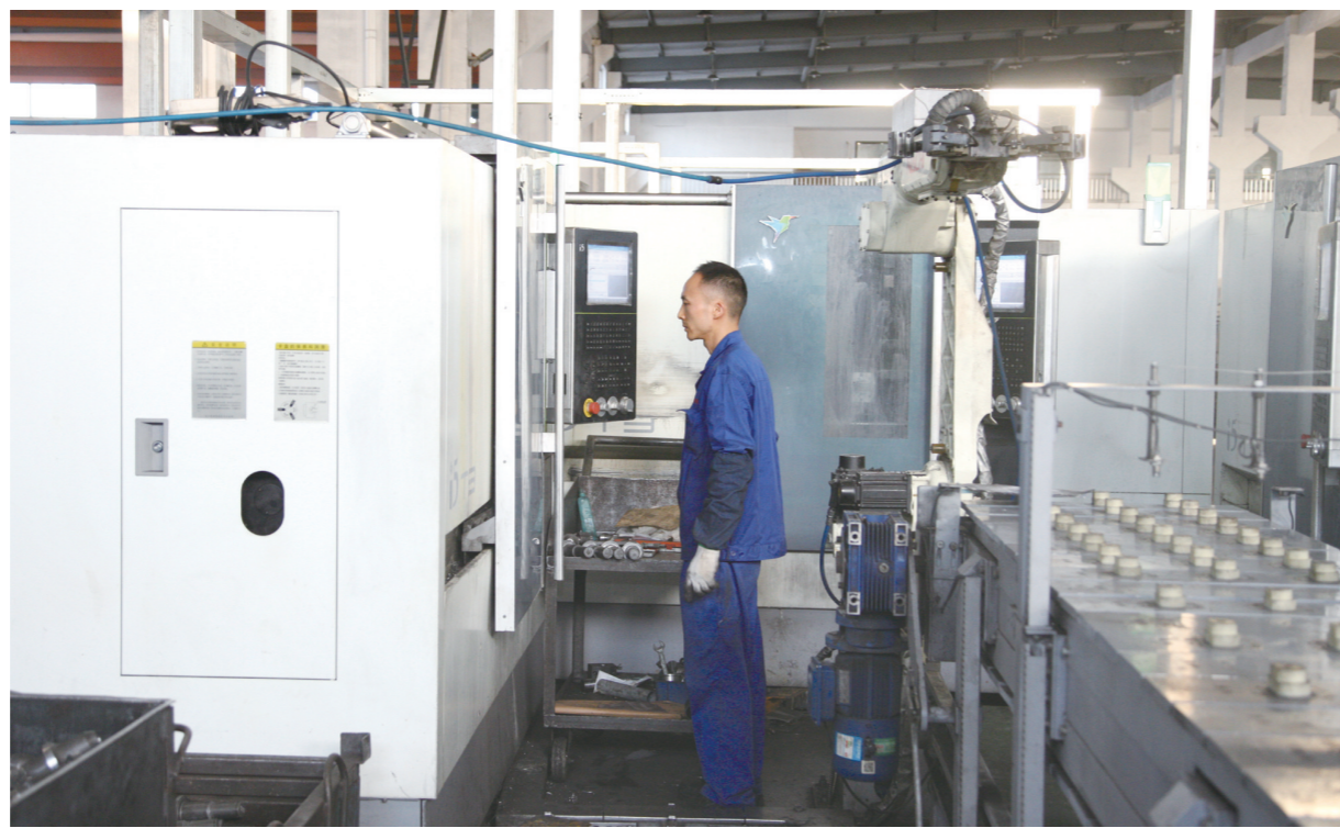
11月13日，盐城中德精锻股份有限公司生产车间，工作人员在操作新设备。该公司加大引进生产设备力度，采用国内外先进的精密冷锻制造工艺，生产内外等速万向节、法兰等精密锻件产品。目前，该公司正奋力冲刺全年目标任务，生产订单已排至明年4月份。

活动期间，该委利用党支部微信平台将《党章》《中国共产党纪律处分条例》《中华人民共和国监察法》上传，要求机关工作人员结合金丰廉政微信公众号发送的具体案例进行法纪教育学习，每人上交一篇学习法纪教育心得体会，择优上报。并利用星期六党校学习日以党小组为单位进行心得体会交流发言。党委领导班子成员中心组学习组就《党章》《纪律处分条例》《监察法》进行专题学习、专题讨论。该委主要负责人给全委人员上了《拒腐防变“严”字当头》的党课，要求全委人员严以修身筑防线，严以用权守底线，严以律己拒红线。（沈建军）